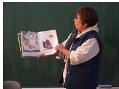
【第3学年読み聞かせの様子】