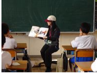
【第6学年読み聞かせの様子】