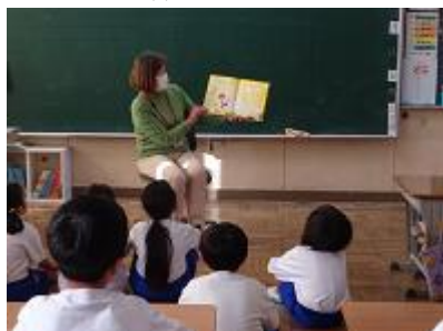
【第1学年読み聞かせの様子】

11月16日(木)にマルベリーの皆さんによる読み聞かせがありました。今回も、子供たちの発達段階に合わせた本を選び、「読み聞かせ」を行っていただきました。