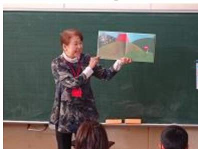
【第2学年読み聞かせの様子】