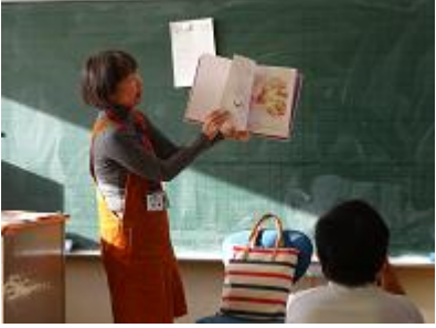
【第5学年読み聞かせの様子】