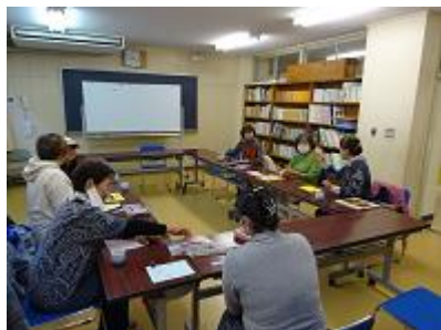
【読み聞かせを終えての振り返り1】