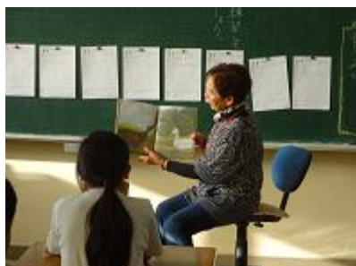
【第4学年読み聞かせの様子】