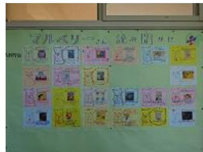
【読み聞かせの軌跡】

マルベリーの皆さんは、和やかな表情で子供たちに語りかけていました。全ての教室が温かな空気に包まれ、幸せな時間を過ごしていました。