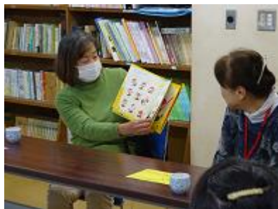
【読み聞かせを終えての振り返り2】