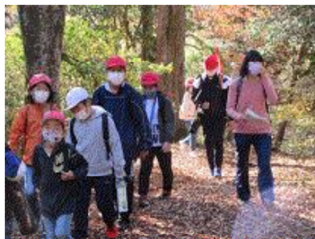
【原生林探検の様子】