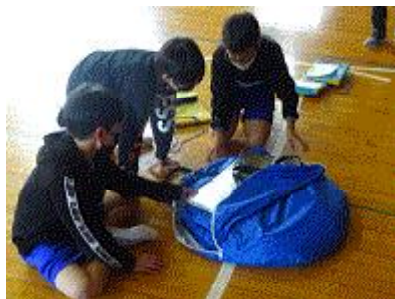
【力を合わせて組み立てよう】