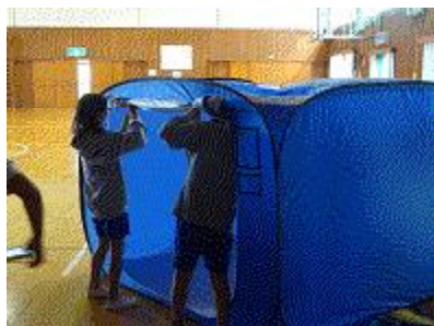
【もう少しで完成だ】