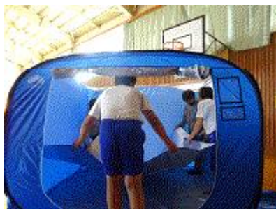
【さあ、下にシートを敷こう】