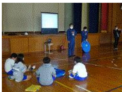
【組み立て方の説明】

今回は、避難所設営訓練を行いました。子供たちは、担当者の指導のもとパーティションを組み合わせ、実際にテントの中で過ごすことにより、避難者の気持ちを体感しました。