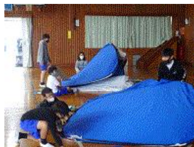
【大きくなってきたよ】