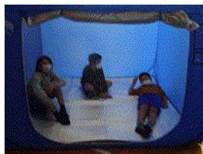
【避難者の気持ちを感じて】