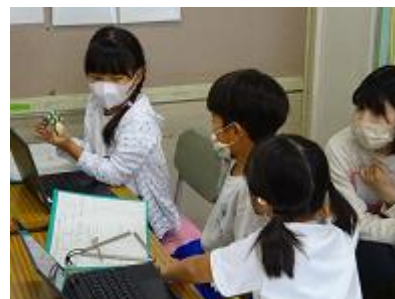
【1年生の授業の様子】

前回、江川教諭の1年生の音楽科の授業「世界に一つだけのわたしの音」を紹介しました。この授業では、子供一人一人が学習課題を設定し、その解決に向けて五感を働かせて体験的に学び、ときに友達と協働でその解決にあたりました。また、文字での振り返りを行い、自分が学んだことを見つめ直すことで、自分が成長したことや課題を見だし、これからの学びに生かしていきました。